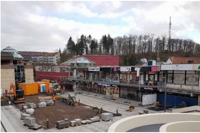
Die Bauarbeiten zur Umgestaltung des in die Jahre gekommenen Montmorillon-Platzes sind in vollem Gange.