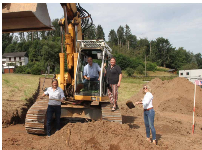
Spatenstiche: Während in Nunkirchen 17 Grundstücke auf Newer neu entstehen ...

Auch wenn uns die Baulückenthematik und die restriktiven Vorgaben der Landesplanung die Aufgabe, Bauland für Bauwillige zur Verfügung zu stellen, alles andere als einfach ma-