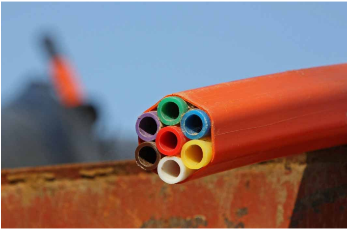
Dem kleinen Kabel gehört die Zukunft: Die Stadt Wadern will den Glasfaserausbau in Kooperation mit der energis GmbH angehen.