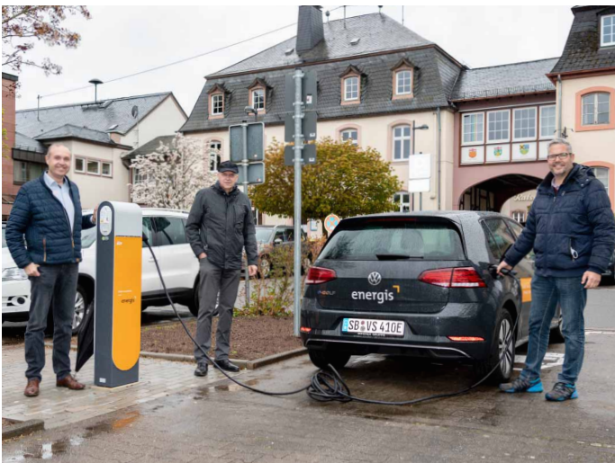
Der Elektroantrieb ist auf dem Vormarsch. Unser Foto zeigt die Einweihung von zwei Ladesäulen auf dem Öttingen-Sötern-Platz im Mai dieses Jahres.

Das Ergebnis der Bundestagswahl vom 26. September 2021 und die daraus resultierende Regierungskoalition lässt im Übrigen wenig Zweifel daran aufkommen, dass sich in Sachen Klimaschutz eine Menge tun wird. Dabei wird der Ausbau von erneuerbaren Energien eine ganz gewichtige Rolle spielen. Sollen die hoch gesteckten Ziele erreicht werden, wird das nur über neue Vorgaben in Sachen Ausbau von Windkraft- und Photovoltaikanlagen gehen. Das mag nicht jeder gut finden, die Tendenz ist allerdings mehr als absehbar. 2022 verspricht auch unter diesem Gesichtspunkt ein spannendes Jahr zu werden.