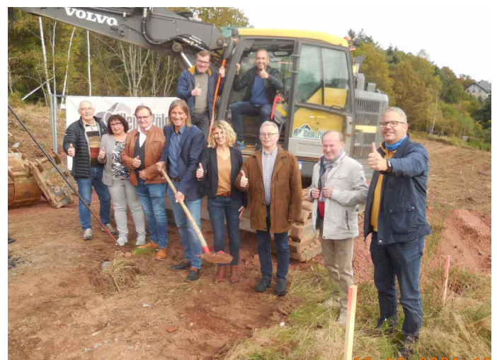
... umfasst das Projekt „Siedlungsgebiet Scharfenberg“ in Steinberg 12 Bauplätze. Gebaut werden kann in beiden Neubaugebieten ab Mitte 2022.

Was tun also? In kleinerem Ausmaß sind wir hier bereits aktiv. Wer aber wirklich umfassende Veränderung will, kommt an einem Paradigmenwechsel nicht vorbei. Man darf sich dann nicht scheuen, Häuser, wenn nicht sogar ganze Häuserreihen, abzureißen und alte Strukturen aufzuheben. Man muss dann den Mut haben, mit neuen Planungen die Flächenaufteilungen zu schaffen, die in unsere heutige Zeit passen. Wenn man diesen Mut hat, fehlt dann allerdings