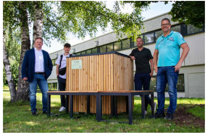
Der „AwaTree“ tut seit Sommer in Wadern seinen Dienst, ein smarterer Würfel, der zur Baumbewässerung eingesetzt wird. Wadern war deutschlandweit der erste Standort.

Man muss hier als Kommune, ob Aufgabenträger oder nicht, die Dinge selbst in die Hand nehmen. Machen wir! Beispiel Glasfaserausbau. Ich kenne viele andere Städte und Gemeinden, die, nachdem sie einen Kooperationsvertrag eines Anbieters vorgelegt bekommen haben, diesen blindlings unterschrieben haben. „Hauptsache jemand nimmt die Sache in die Hand!“ Dabei lohnt es sich gerade hier, genau