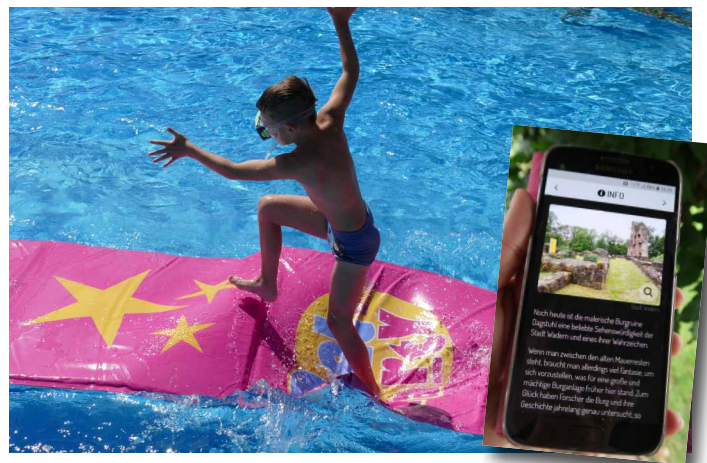
Ein großer Lichtblick in diesem wettermäßig eher trüben Sommer waren die Poolparty für Kinder im Waderner Freibad und das Märchenfest der besonderen Art rund um Schloss Dagstuhl (kleines Foto).

Apropos investieren. Im März dieses Jahres hat der Stadtrat der Stadt Wadern einstimmig den Doppelhaushalt 2021/2022 verabschiedet. Insgesamt rund 14 Millionen Euro Investitionen sieht das Zahlenwerk vor. Mehr als wir realistischerweise allerdings im überplanten Zeitraum abarbeiten können – Handwerker- und Fachkräftemangel, extreme Teuerungsrate am Bau und Lieferschwierigkeiten in fast allen Gewer-