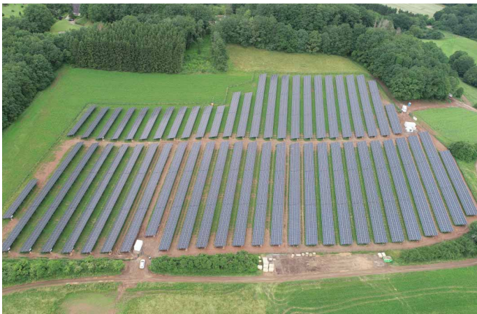
Nach nur zehn Wochen Bauzeit wurde im Sommer der Solarpark Lockweiler in Betrieb genommen. Mit einer Jahresproduktion von 3.600.000 KWh können theoretisch über 1000 Haushalte versorgt werden.